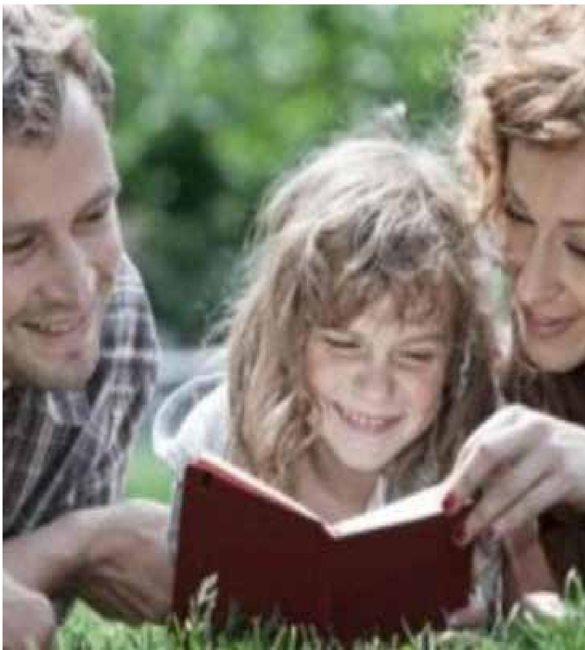
Hombre y mujer en la tarea de enseñar a su hija.

Frente a preguntas sobre la participación de padres de niños y niñas menores de siete años en las ac-