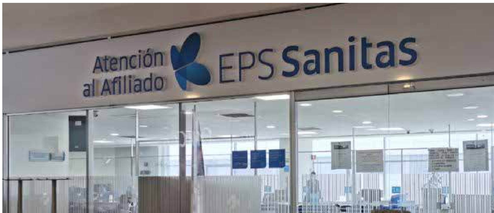
Sanitas EPS intervenida por el Gobierno.

La Superintendencia de Salud tomó la decisión de intervenir EPS Sanitas la segunda entidad prestadora de servicios de salud más grande del país, con una cifra de 5,7 millones de afiliados.