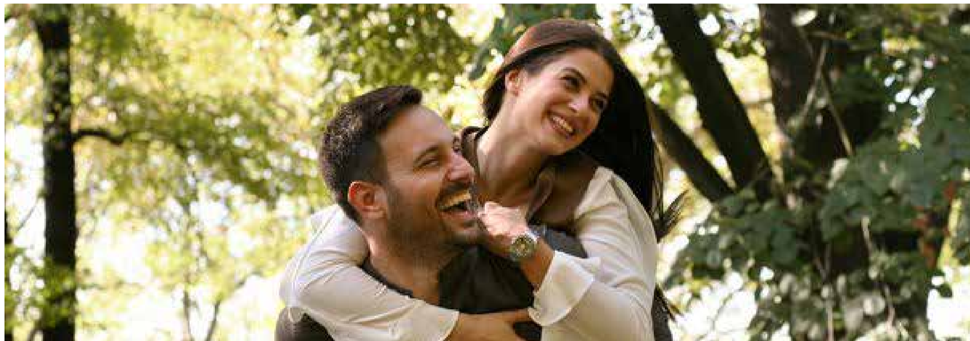
Hombre y mujer

La Encuesta Nacional del Uso del Tiempo (ENUT), encontró que, en Bogotá, las mujeres emplean tres horas y 11 minutos diarios más que los hombres en el desarrollo de las actividades del cuidado no remunerado al interior de los hogares, lo que significa para ellas contar con menos tiempo que los hombres para educarse, desarrollar una actividad laboral remunerada, descansar o divertirse.