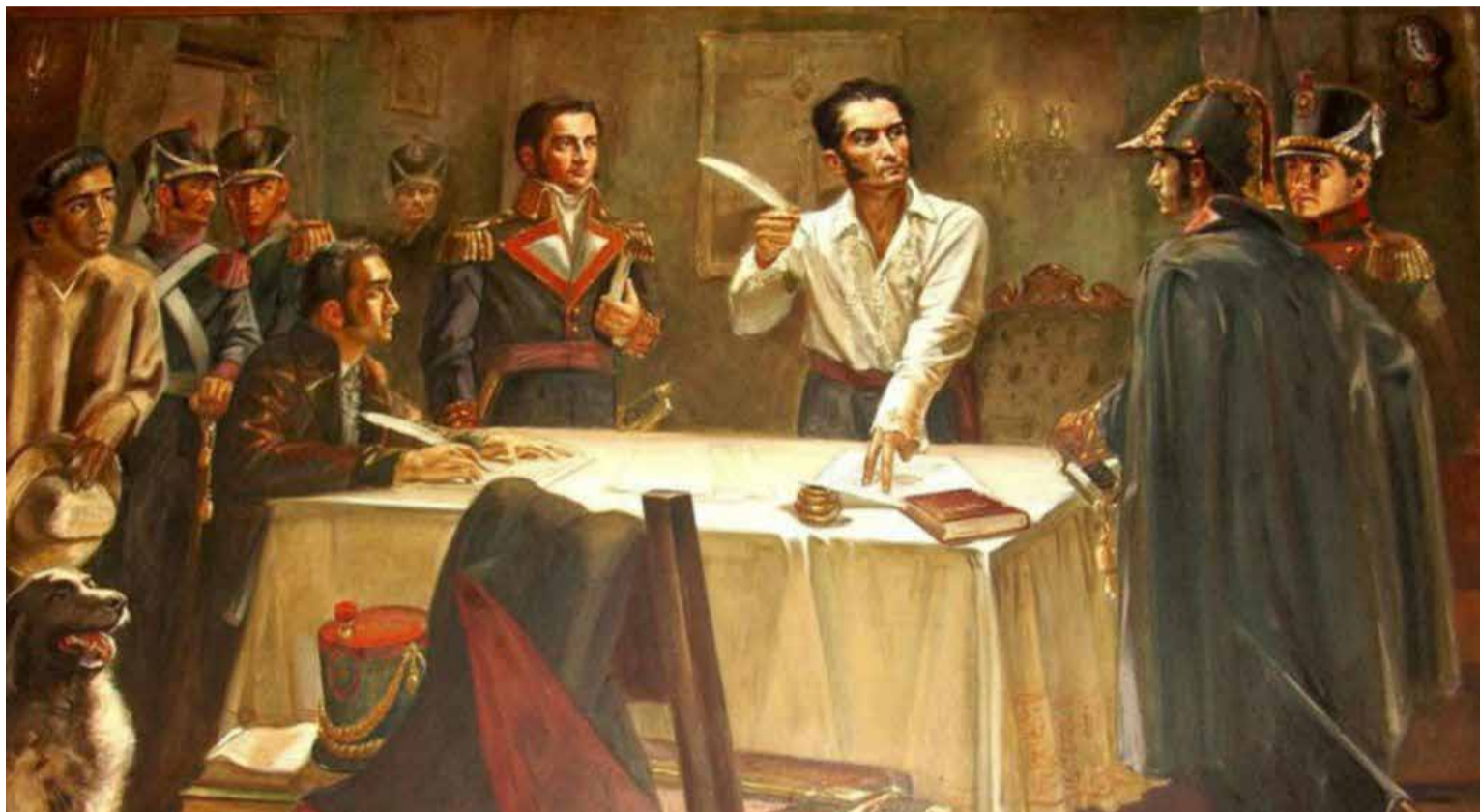
Simón Bolívar en magas de camisa