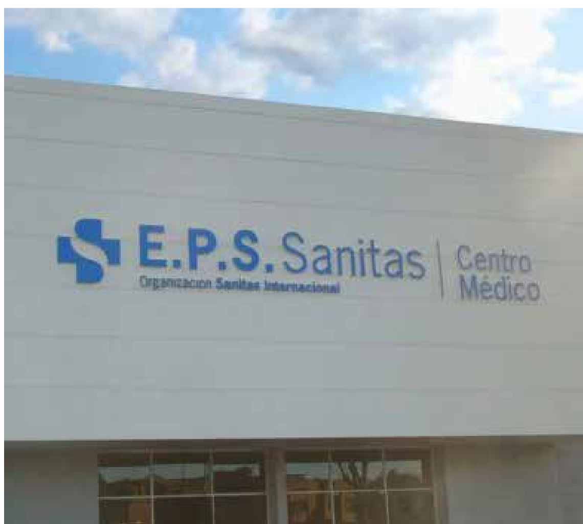
La Superintendencia de Salud tomó la decisión de intervenir EPS Sanitas la segunda entidad prestadora de servicios de salud más grande del país, con una cifra de 5,7 millones de afiliados.

La segunda EPS más grande del país, EPS Sanitas, fue notificada de una intervención administrativa por parte de la