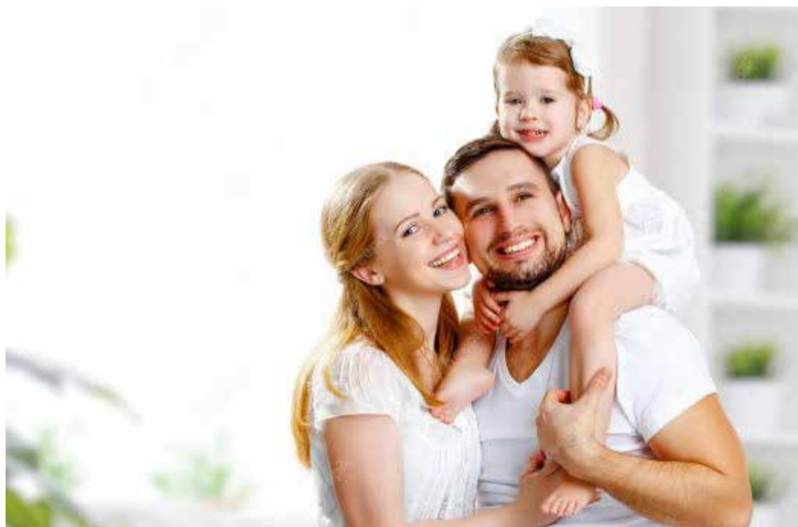
Retorna la felicidad al hogar

díacos Fumar es la principal causa de infartos y enfermedades cardíacas. Pero muchos de estos riesgos cardíacos se pueden revertir simplemente dejando de fumar. Dejar de fumar puede reducir la presión arterial y la frecuencia cardíaca casi de inmediato. Su riesgo de infarto disminuye a las 24 horas de dejar de fumar.