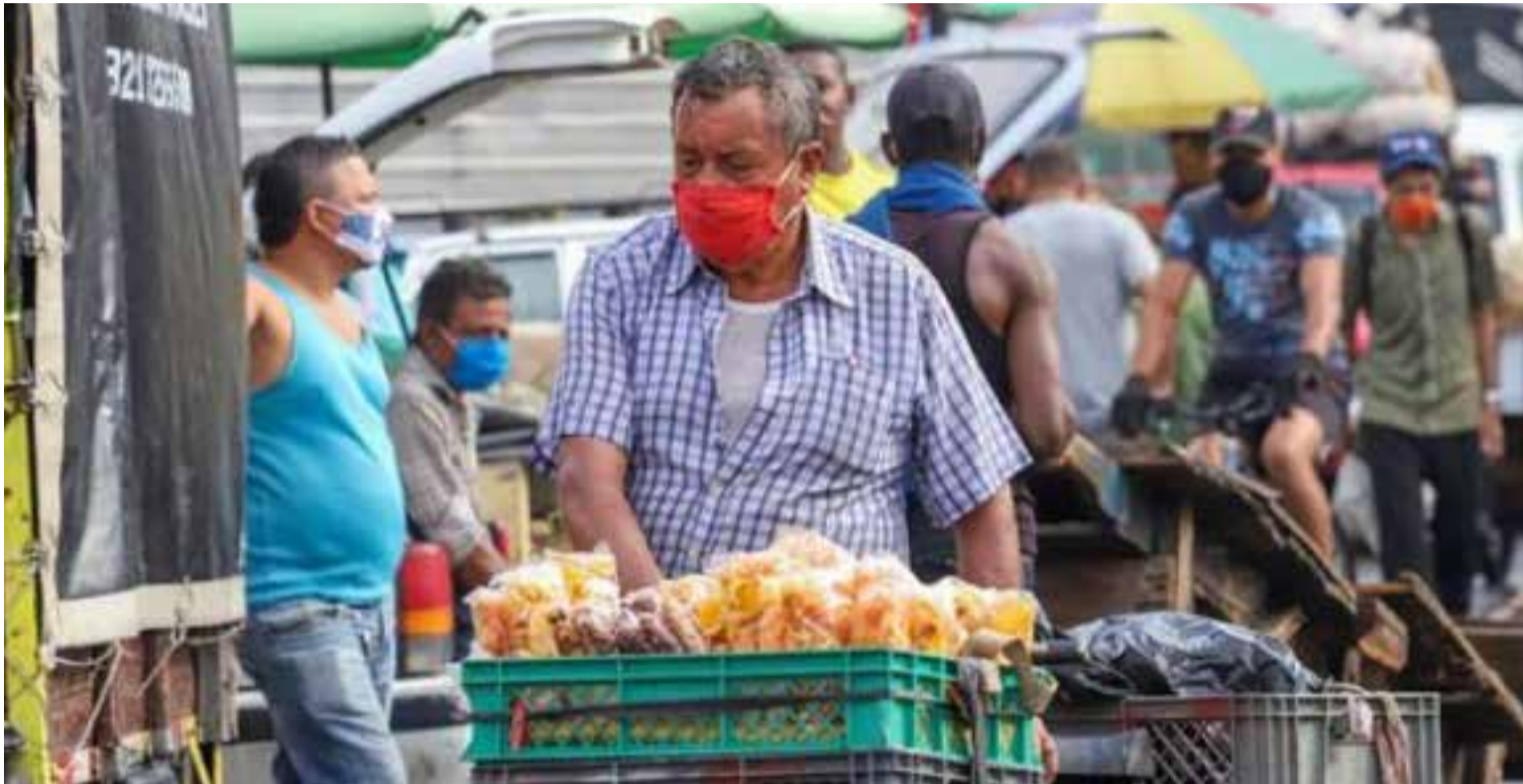
Adultos mayores tienen que acudir a las ventas ambulantes para poder sostener su respectivas familias.